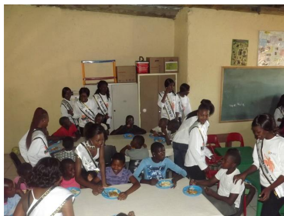
Miss Hazyview kandidater med några av barnen

En annan dag kom personalen från Shell macken tillsammans med personal från en pizzeria och tillbringade tid med barnen. Lekar och sång fick barnen att glömma sin svåra situation i livet.