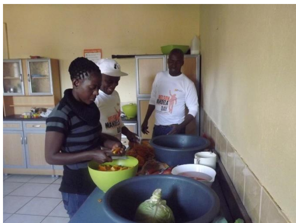
Volontärer som lagar mat

Personal från IDC (Industrial Development Cooperation) kom tillsammans med kandidaterna till Miss Hazyview. Dom lagade mat till och tillsammans med barnen, organiserade tävlingar och donerade en god summa pengar. De engagerade volontärerna försökte ingjuta hopp för framtiden och betonade att barnens situation inte måste vara permanent. Jobba hårt i skolan och försök att få bra betyg för att få ett bra jobb. Ja, det är väl ett standardråd till alla barn. Men våra barn suger åt sig dessa råd. De har en stark önskan att få ett bättre liv än de vuxna i deras närhet, som ofta inte är deras föräldrar eftersom deras liv blev allt för kort på grund av AIDS.