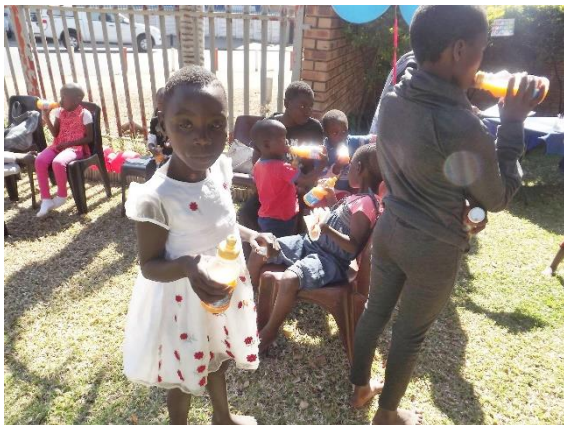
Det är inte varje dag man får en läsk

En dag i juli fick tjugofem av våra barn komma till stan för att träffa andra barn. Det var mejeriproducenten Clover som i Nelson Mandelas namn bjöd in till firande på sin fabrik i staden Nelspruit. Pengar från den svenska Lions kassan stod för transporten.